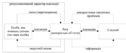
Рис. 23. Взаємодія між слідчим (суддею) і речами (матеріальними об'єктами), — опосередкована взаємодія